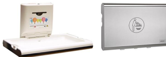
Polipropileno/Acero inoxidable acabado satinado