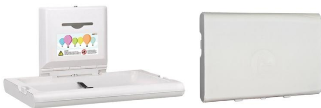
Polipropileno acabado blanco